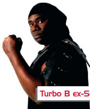
Turbo B ex-SNAP